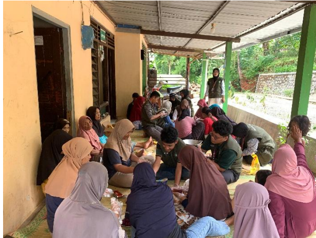
Gambar 2. Pelaksanaan proker bola-bola ubi