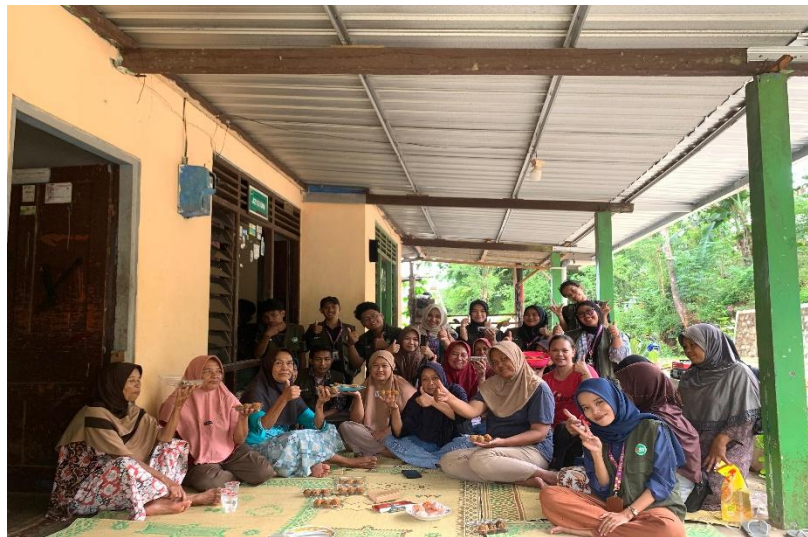
Gambar 3. Proker bola-bola ubi selesai dilaksanakan di rt 19